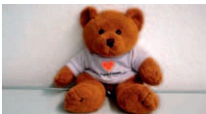
Schweizerisches Rotes Kreuz