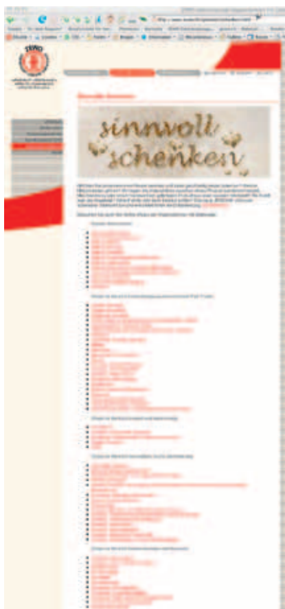
www.zewo.ch – Sinnvoll schenken