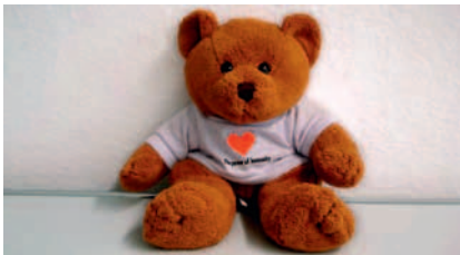
Schweizerisches Rotes Kreuz