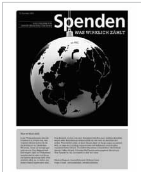
Spendenbeilage 2010 in der SonntagsZeitung und NZZ am Sonntag vom 12. Dezember 2010

Zum Abschluss der Kampagne hat die Zewo gemeinsam mit Swissfundraising , dem Berufsverband von Fundraiserinnen und Fundraisern für Non-Profitorganisationen, zum zweiten Mal in Folge eine Sonderbeilage rund ums Spenden herausgegeben. Sie ist mit einer Auflage von rund 400 000 Exemplaren in der SonntagsZeitung und in der NZZ am Sonntag vom 12. Dezember 2010 erschienen. Die Plattform wurde genutzt, um auf die wertvolle Arbeit, die Hilfswerke mit der Unterstützung von Spenderinnen und Spendern leisten, aufmerksam zu machen. Hilfswerke konnten zeigen, was sie mit den Spenden bewirken und Spendende haben Tipps und Informationen erhalten. Dank der grossen Zahl von Inserenten konnte in diesem Jahr eine etwas umfangreichere Beilage gestaltet werden. Im Jahr 2011 soll die Spendenbeilage wiederum als Kooperation von Zewo und Swissfundraising in einer Sonntagszeitung erscheinen.