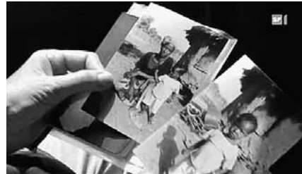
SRF Dok Sendung Reporter Zewo äussert sich im Beitrag «Mein Patenkind in Mali – Vom Geschäft mit den grossen Kinderaugen»

Insbesondere im November und Dezember war das Interesse der Medien zu Themen rund ums Spenden gross. In der Sendung Reporter vom 24. November wurde mit dem Beitrag «Mein Patenkind in Mali – Vom Geschäft mit den grossen Kinderaugen» die Problematik von persönlichen Patenschaften mit direkten Kontaktmöglichkeiten zur Kindern in den Ländern des Südens thematisiert. Die Zewo und die Schweizer Hilfswerke, die in der Entwicklungszusammenarbeit tätig sind, lehnen diese Form von Patenschaften ab. Der Beitrag hat illustriert, wie der emotionale Druck